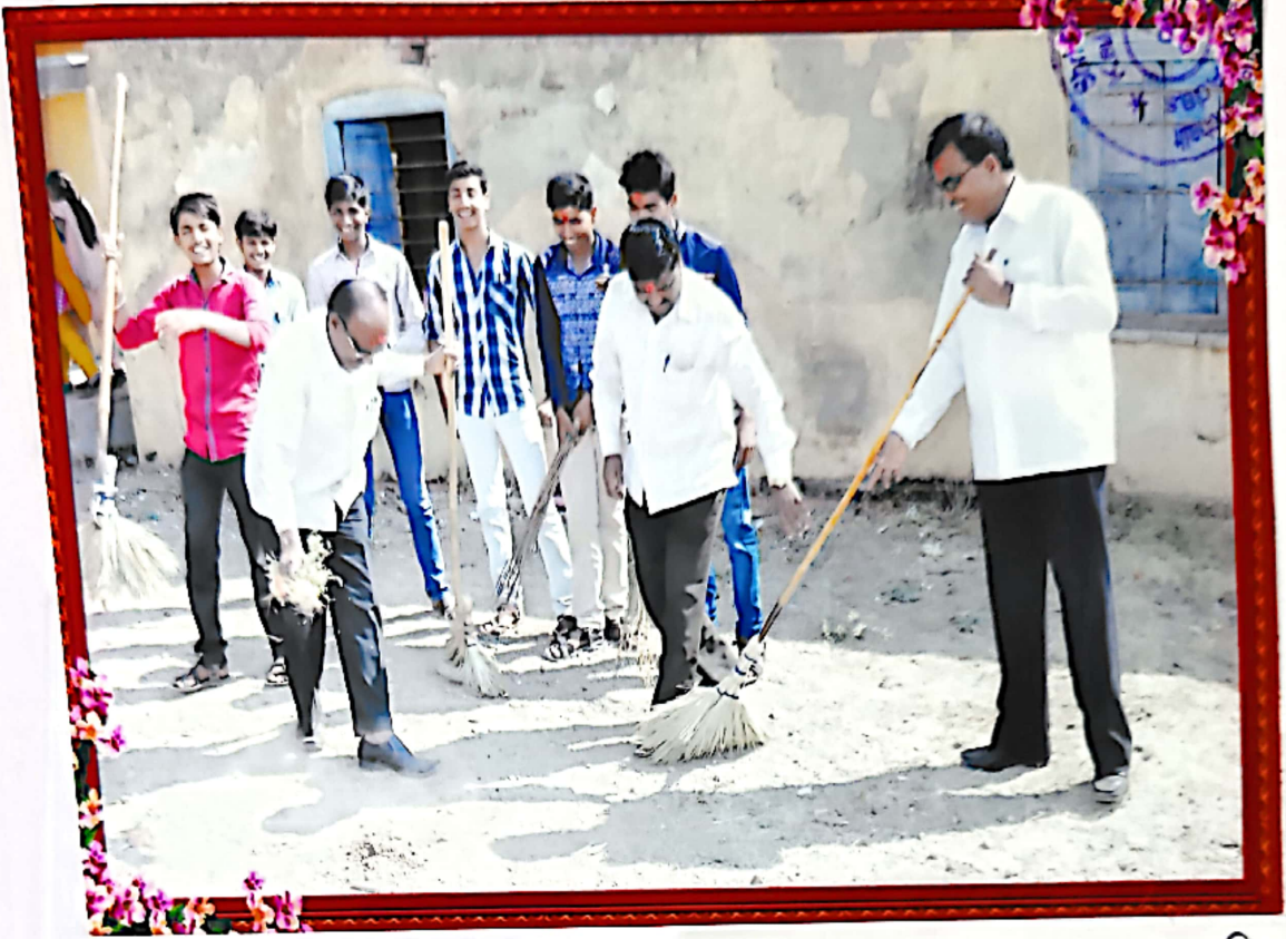
कला महाविद्यालय आठव्या व्रेथे N.S.S. विभागांत अंतर्गत ग्राम स्वच्छता उपक्रम राबवताना विद्यार्थी व शिक्षक वृंद